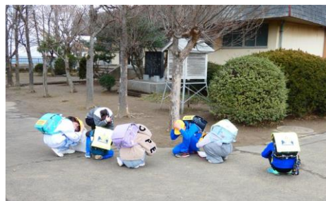
下校中に「Jアラート」が流れたら

全校で避難訓練を実施しました。「その場所や状況に合わせて、あわてずに自分の身を守る行動がとれる」というのがねらいです。だれもが真剣に話を聴き、指示どおりに安全な行動がとれました。こうして訓練を重ねることで、「自分の命は自分で守る」ことができるようになると思っています。