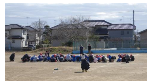
校庭の中央に集まって 体を低く頭を守る姿勢