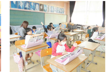
【4年生・音楽】 鍵盤ハーモニカで、楽しく合奏しました。