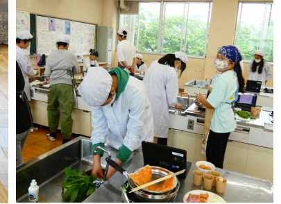
【6年生 家庭科】 調理実習で、野菜炒めを作りました。