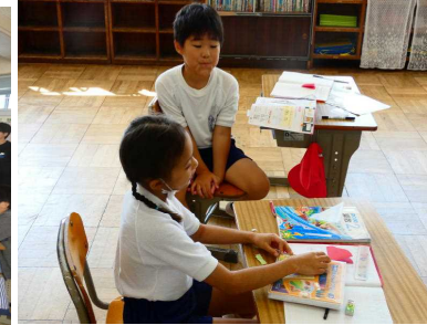
【2年生 算数】 ペアで話し合って解き方を考えました。