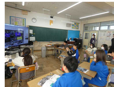
【5年生 社会】 NISSANとオンラインでつないで学習しました。

子どもたちは、日々、生き生きと学習に取り組んでいます。こうした学びの充実は、後援会費にご協力いただいたおかげで、学習に必要な教具や備品の購入、さらに、学校環境の整備を行うことができたことによるものです。地域の皆様、お一人お一人の温かいご支援に、心より感謝申し上げます。