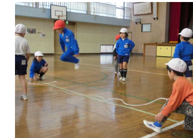
【1年生・体育】 大縄跳びや短縄跳びを頑張っています。