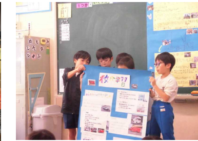
【3年生・社会】 警察署や消防署見学のまとめの発表会をしました。