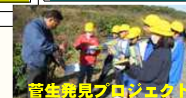
菅生発見プロジェクト

研究主題:他者と協働し、互いのよさを生かしながら、主体的に課題を解決しようとする児童の育成 —支持的風土の基盤となる「絆づくりプロジェクト」と地域の教育資源を積極的に活用した 探究的な学び「菅生発見プロジェクト」を通して—