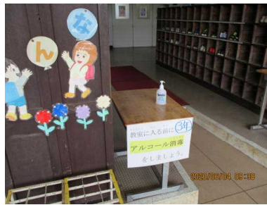
②昇降口での手の消毒