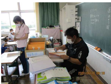
①毎日の検温チェック