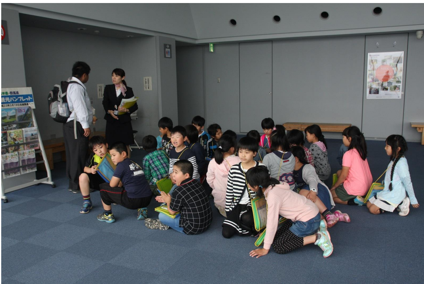
茨城県庁 25階展望ロビーにて