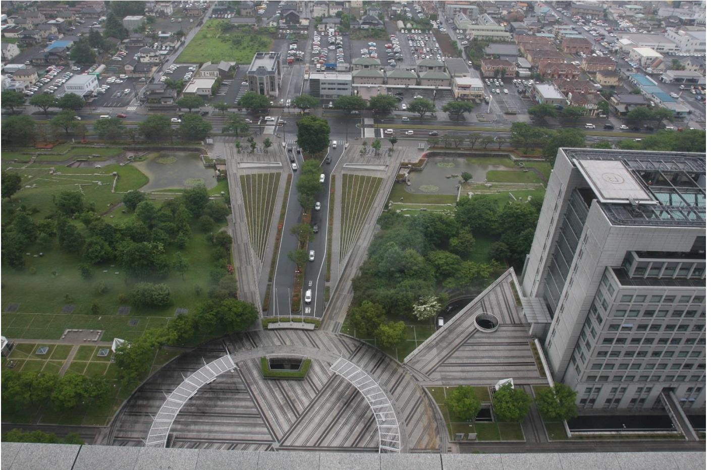
展望ロビーからの眺め（右の建物は茨城県警察本部）