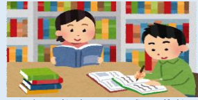
個人で行う自習や読書