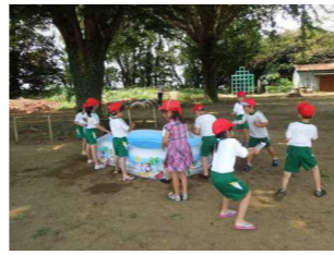
1年生夏となかよし