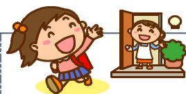
全学年 児童アンケートの結果

2学期末、保護者の皆様には「学校教育に関する調査アンケート」にご協力いただきありがとうございました。ここに児童のアンケート結果とともに集計結果をお知らせします。また、これを参考に来年度の教育活動に生かしていきたいと考えています。