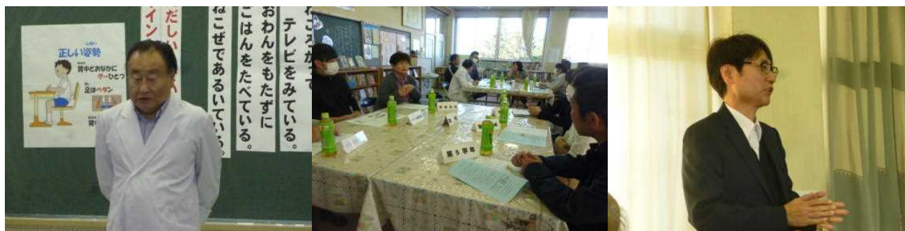
歯科医さんのお話