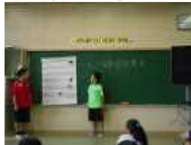
「カスタムシの好きな物って 何だろう」