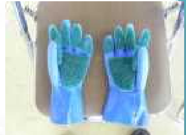
「水道をそうじする手袋」