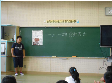
「カスタムシのメスは、ど くらい卵を産むのか？」

夏休みに取り組んだ科学研究作品や発明工夫作品、統計グラフ等の発表の場を設け、科学に親しむ心やその他の研究・作品への興味や関心を高めるために毎年実施しています。子どもたちが、考えたり、悩んだり、心をこめて創り上げた作品です。