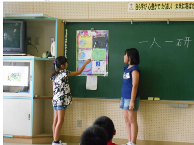
「福祉について」 わたしの幸せ みんなの幸せ