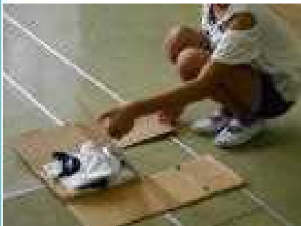
「段ボールを使っ て、洋服たたみ」