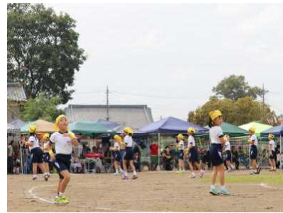
<おどってみよう！> 1～3年