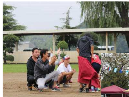
<カモンベイビー ゴールまで>