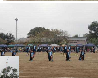
<大花羽ソーラン2018> 4～6年