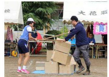
<その荷物半端ないって>