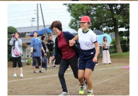
<相棒になってくれませんか>