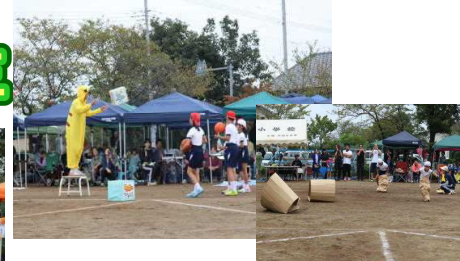
<ラッキーアイテム ゲットだぜ！>