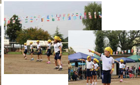
<おどってみよう！> 1～3年