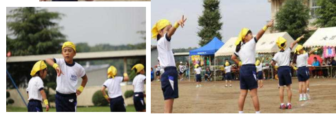
<つかめラッキーチャンス>