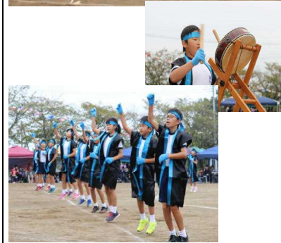
<大花羽ソーラン2018> 4～6年