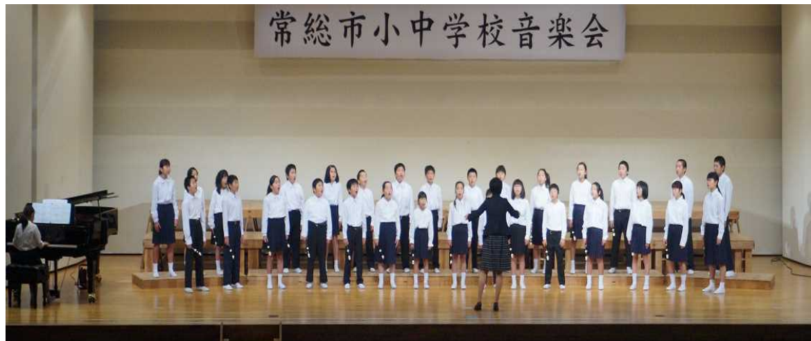
常総市小中学校音楽会

11 / 2(木) 素晴らしい歌声を披露することができました。感動をありがとう!!