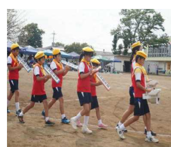
鼓 笛 ド リ ル