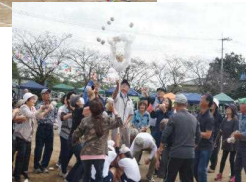
なかよく玉入れ (敬老祖父母・1～3年)