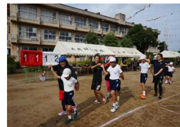
みんなで踊ろう ヤンチャリカ