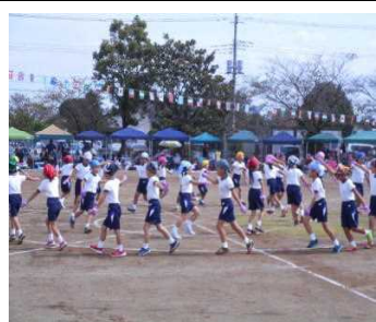
踊るは恥だが役に立つ！？ (1～3年生)