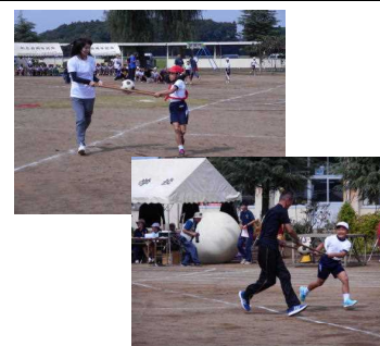
はさんで、GO・GO (3・4年生・PTA)