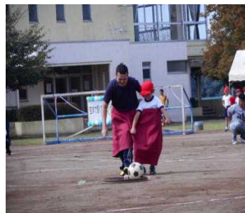
パワー全開！！ (1・2年生・PTA)