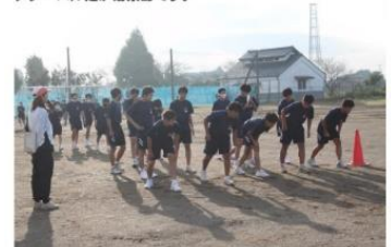
まずは、半周をダッシュします。体力をもとすには、インターバル走が効果的です。

10月20日（水）に県西地区中学校駅伝競走大会、11月10日（水）には県中学校駅伝競走大会が実施されます。近年は、男女で県中学校駅伝大会も出場することができています。本校には陸上競技部はありませんが、毎年選抜生徒を中心に駅伝大会に参加しております。