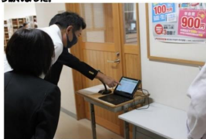
本日、神達常総市長が本校の検温システムの視察に朝から訪れました。