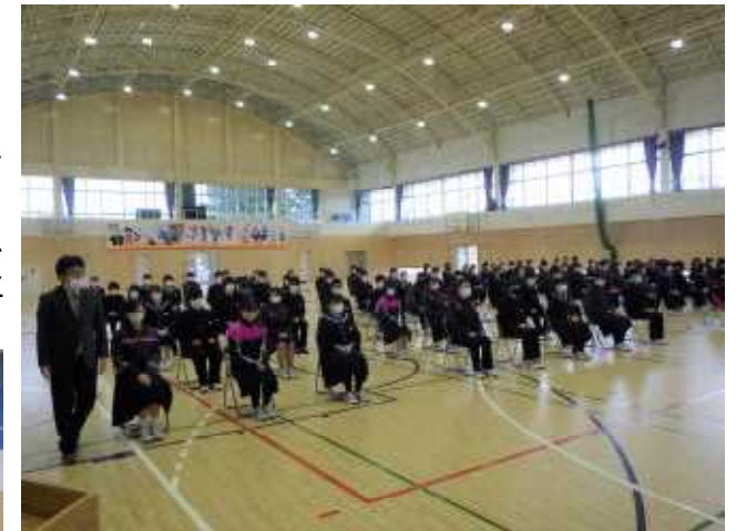
予行での3年生の立派な態度

3月8日(火)、卒業式予行が行われました。卒業式予行では、本番への期待が膨らむような素晴らしい態度でした。11日には、今まで育ててくれた家族に感謝の気持ちを込めて、成長した姿を見せてほしいと先生達は願っています。