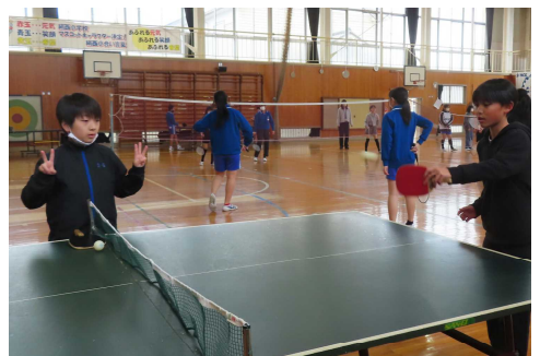
卓球・バドミントンクラブ