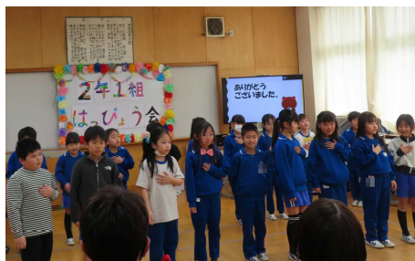
2年生（できるようになったよ発表会）