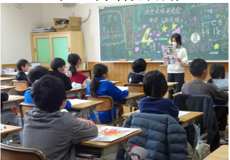
4年生（決意表明発表会）