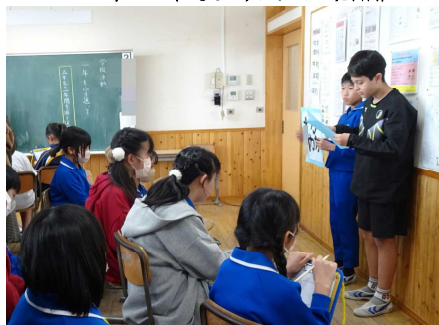
5年生（5年生でがんばったこと、6年生に向けての抱負）