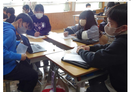
6年生（SDGsについての発表会）