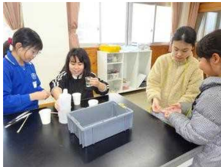
観察・実験クラブ