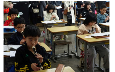
3年生（3年生でがんばったこと、4年生でがんばりたいこと発表会）