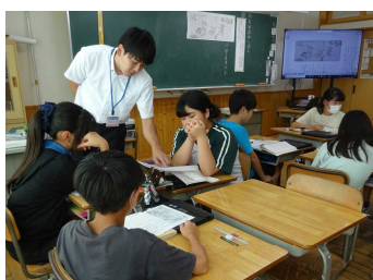
県教育研修センターの先生をお迎えしての授業公開・研究協議