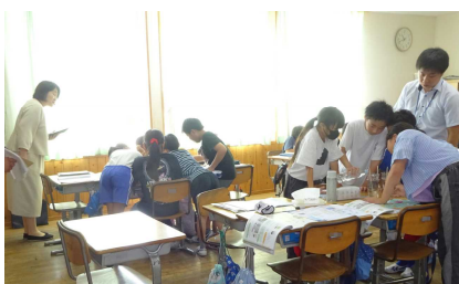
県西教育事務所の先生をお迎えしての授業公開