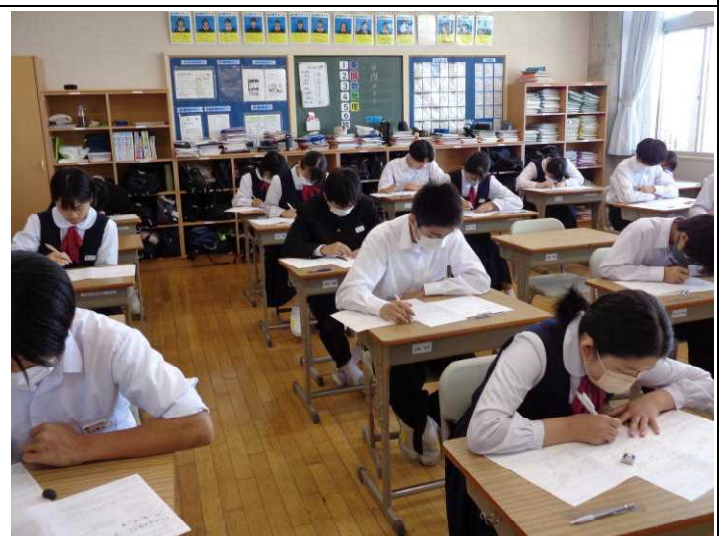
3年生 得意不得意はあるけれど全力