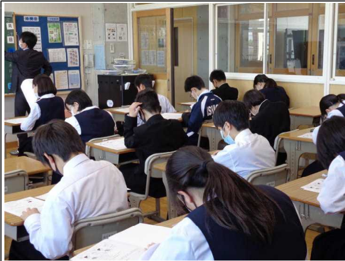
1年生初めてのテスト できるかなー