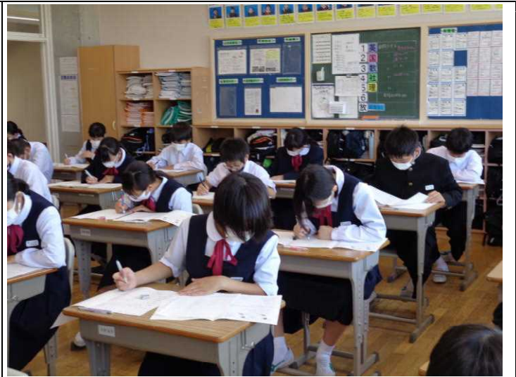
1年生 よし、これなら分かる