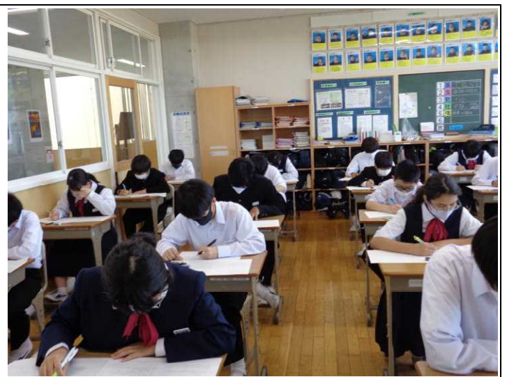
2年生 よしやるぞー