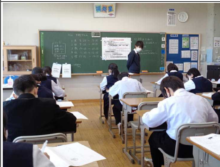
1年生 頑張ってます