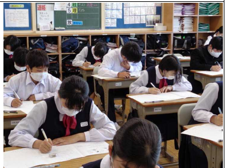
3年生 誰も真剣です