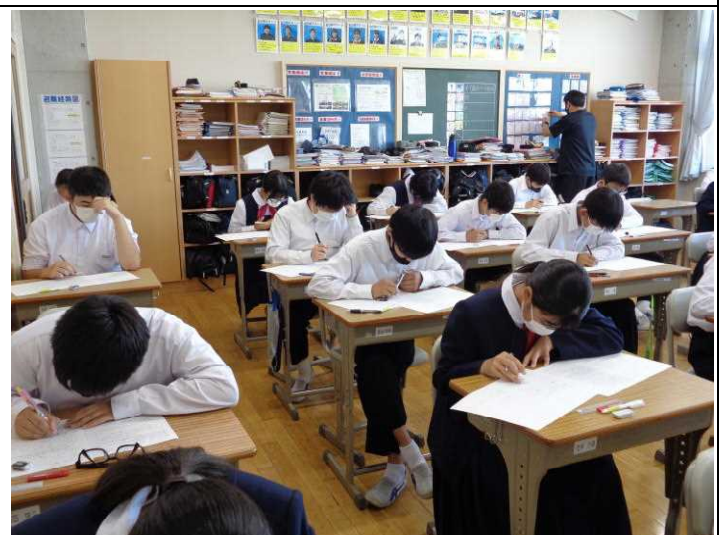
2年生 今年最初のテストしっかり