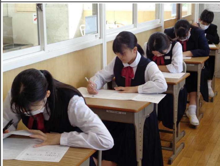
3年生 集中して取り組む生徒たち