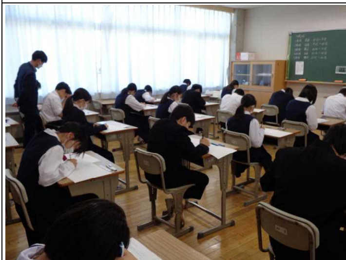
2年生 みんな頑張れー